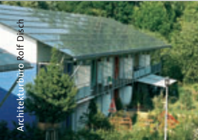
Architekturbüro Rolf Dilsch