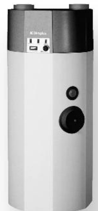
Dimplex BWP30 HLW