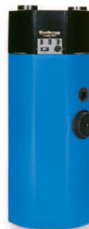
Logafix WPT300 M