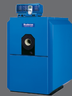
Logano plus SB625

In spektakulärer Lage mit perfekter Aussicht garantiert die neue Stieralm in der Tourismusregion Nauders am Reschenpass ein Highlight, das moderne Spitzengastronomie mit gelebter Tradition vereint. Die Revitalisierung der historischen Stieralm ist ein Leuchtturm-Projekt, das ein nachhaltiges Gebäudekonzept mit modernster Heiztechnik von Buderus verbindet.